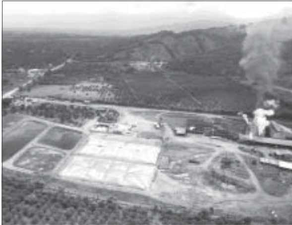
Figura 1. Eecopalsa, Honduras: Planta de Biogás de 1.2 MW.

usualmente consideradas como el patio trasero y pozo séptico de las extractoras, lo que no las hace dignas de atención a menos que las circunstancias lo apremien. Es común verlas acidificadas y con acumulación de problemas, obligando las extractoras a redireccionar los efluentes hacia otros sitios o construir lagunas nuevas.