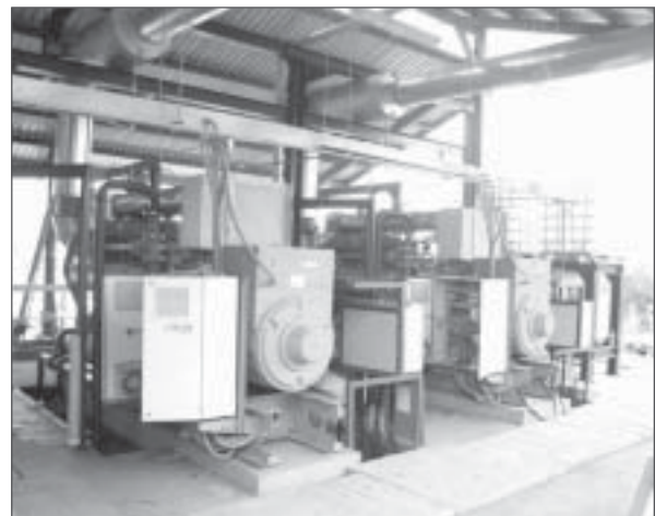
Figura 3. Eecopalsa (Honduras): Dos motores de biogás de 630 kW c/u.