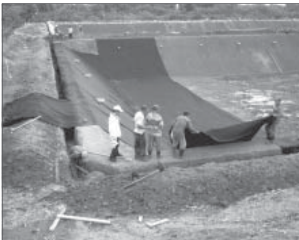
Figura 2. Palmas del Espino (Perú): Construcción de las lagunas.

La operación de lagunas anaerobias o biodigestores no es difícil pero requiere de un mínimo de atención y mantenimiento. En particular, el control de la temperatura y caudal de entrada y el control del pH.