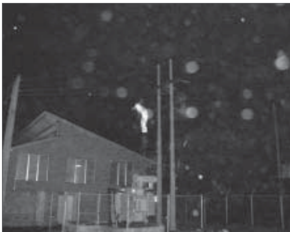
Figura 4. Eecopalsa (Honduras): Tea en operación nocturna.

El incremento del precio del petróleo en los años 2005 y 2006 ha cambiado radicalmente el valor económico del biogás y la visión de los industriales sobre él.